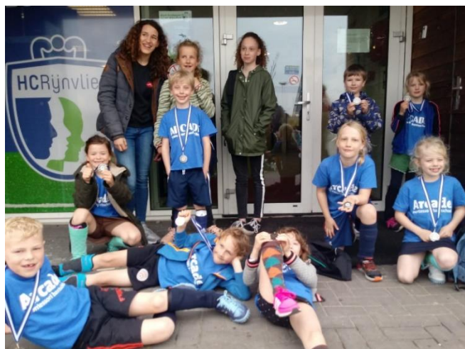
Arcade Team Groep 4