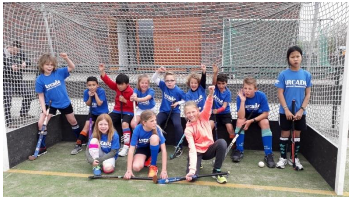
Arcade Team Groep 5/6/7

Groep 5 team heeft alle wedstrijden heel overtuigend gewonnen, één wedstrijd zelfs met 9-0. Ze hebben door een ijzersterke verdediging geen enkel doelpunt tegen gekregen! Na een zeer spannende finale tegen een ander sterk team eindigde ze met 0-0 na veel mooie kansen. Daarna kwamen de shoot outs, niet normaal zó spannend was het! Het andere team schoot er 3 van de 7 in. Arcade groep 5 knalde er zo 4 achter elkaar in, zonder twijfel de verdiende winnaar en kampioen! En toen was het feest! We kijken met zijn allen dus weer terug op een zeer geslaagde middag!