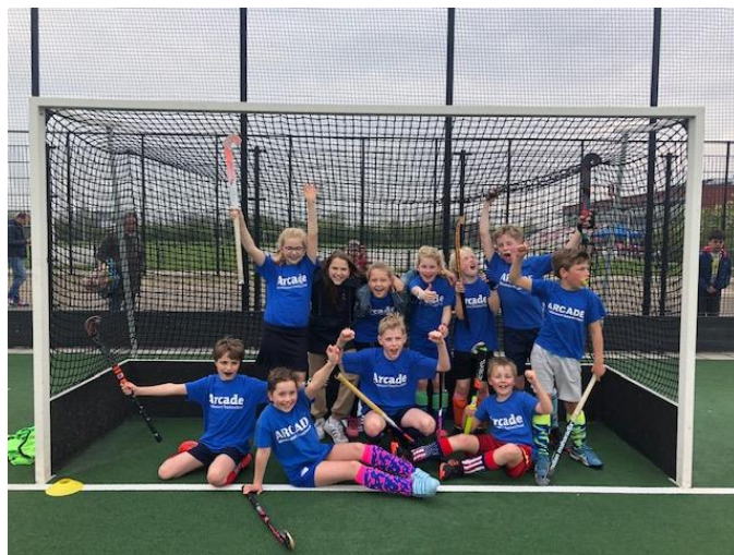
Arcade Team Groep 5